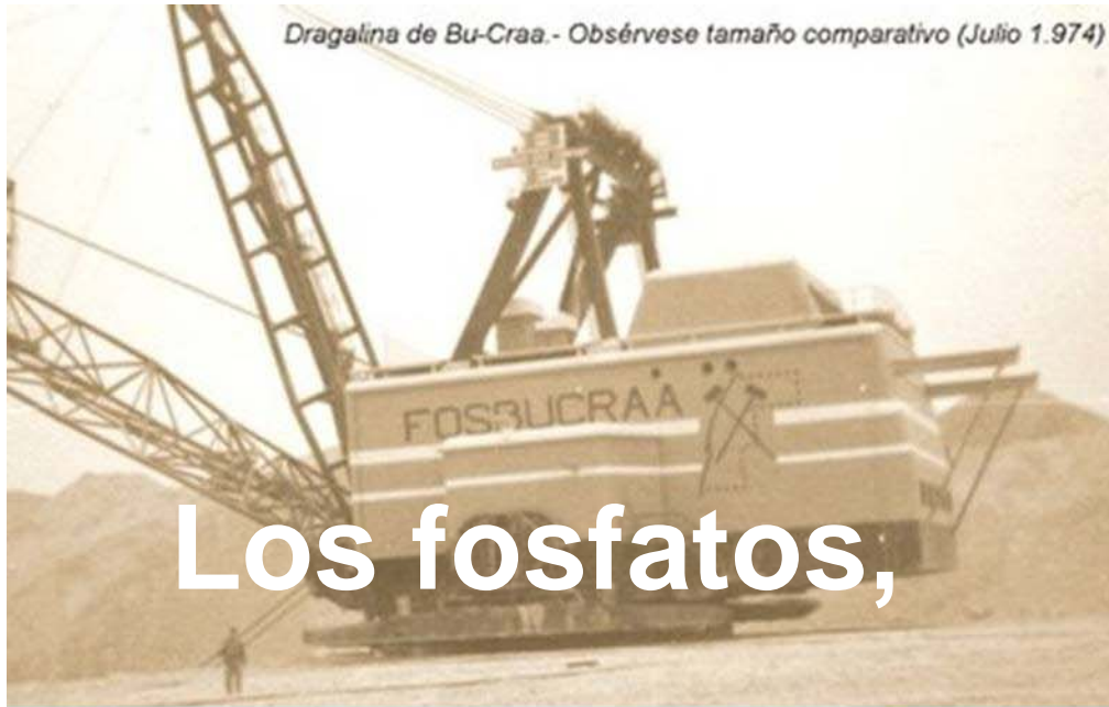
Dragalina de Bu-Craa.- Obsérvese tamaño comparativo (Julio 1.974)